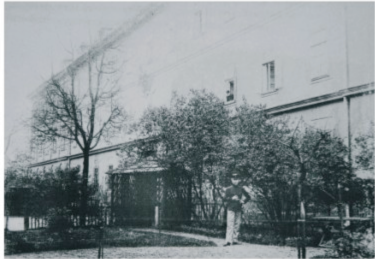
Koszary przy ul. Zatorskiej były m. in. Siedzibą Wojennego Szpitala Zapasowego.

Dla mieszkańców wojennych, których liczba nieustannie rośnie, zbudowano także miasteczko z baraków w Rokowie oraz szpital wojskowy przy drodze Zatorskiej.