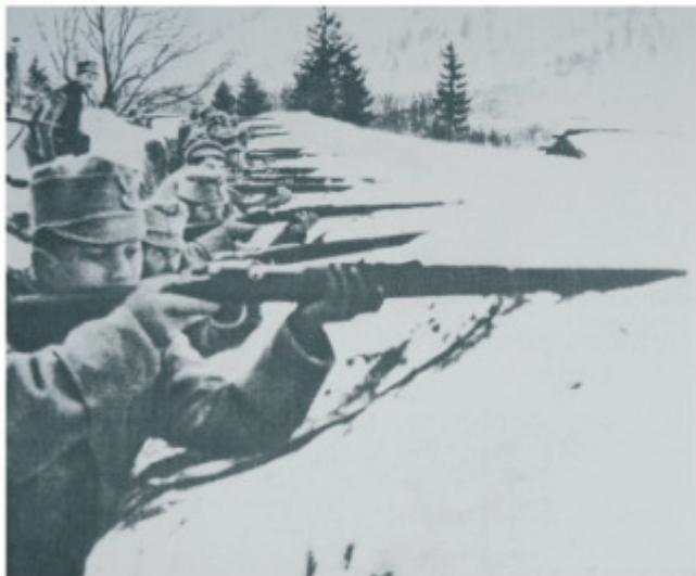
Legioniści 2 pułku piechoty na stanowiskach bojowych. Zima 1914/15.

Odtąd nie ma ani Strzelców, ani Drużyniaków. Wszyscy, co tu jesteście zebrani, jesteście żołnierzami polskimi. Znoszę wszelkie odznaki specjalnych grup. Jedynym waszym znakiem jest odtąd Orzeł Biały (...). Żołnierze!.. Spotkał was ten zaszczyt niezmierny, że pierwsi pójście do Królestwa i przestąpicie granice rosyjskiego zaboru, jako czołowa kolumna wojska polskiego, idącego walczyć o oswobodzenie Ojczyzny. Wszyscy jesteście równi wobec ofiar, jakie ponieść macie. Wszyscy jesteście żołnierzami (...). Patrzę na was, jako na kadry, z których rozwinąć się ma przyszła armia polska i pozdrawiam was, jako pierwszą kadrową kompanię.